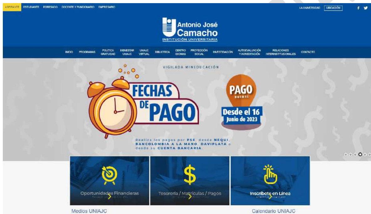
Home Página web Institucional UNIAJC

http://www.uniajc.edu.co/transparencia-y-acceso-a-informacion-publica/